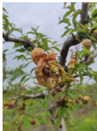
Εξώασκος – Καρούλιασμα φύλλων

Πρόκειται για πρωτογενείς μολύνσεις την εποχή της έκπτυξης των νεαρών φύλλων. Σε περιπτώσεις έντονων προσβολών, προς αποφυγή σημαντικής αποφύλλωσης των δέντρων, συνιστάται επιλογή δραστικής ουσίας στην παραπάνω επέμβαση για την Μονίλια ώστε να επιτευχθεί συνδυασμένη καταπολέμηση. Η επέμβαση αυτή αποβλέπει στην νέκρωση των διεσπαρμένων επάνω στα δέντρα ασκοσπορίων και βλαστοσπορίων.