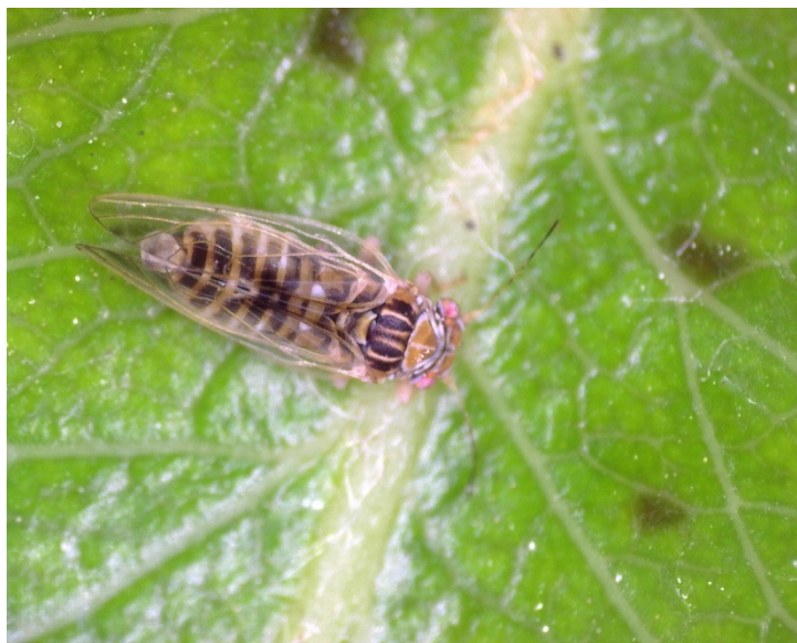
Τέλειο έντομο Cacopsylla pyri της ανοιξιάτικης πτήσης