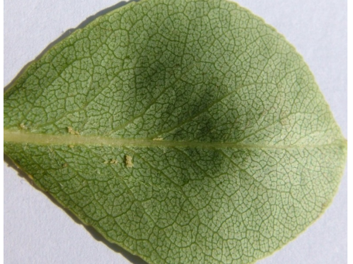
Αυγά και προνύμφες Cacopsylla pyri όπως φαίνονται με γυμνό μάτι