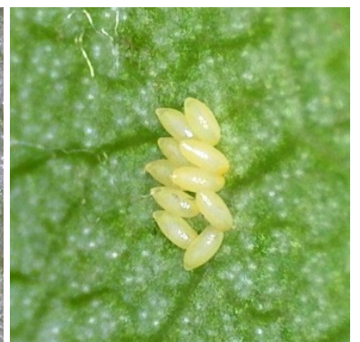
Αυγά νέα-λευκά, αυγά ώριμα-κίτρινα και προνύμφη που εκκολάπτεται όπως φαίνονται από μεγέθυνση

Ο Προϊστάμενος του Π.Κ.Π.Φ.Π. & Φ.Ε. Θεσσαλονίκης