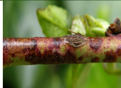
Προσβολή από κορύνεο