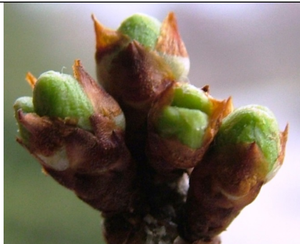
Πράσινη κορυφή Δαμασκηνιά στάδιο C

Ο Προϊστάμενος του Π.Κ.Π.Φ.Π. & Φ.Ε. Θεσσαλονίκης