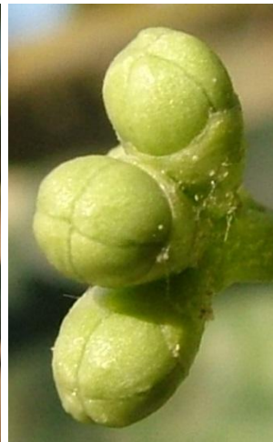
στάδιο Ε Διαφοροποίηση στεφάνης