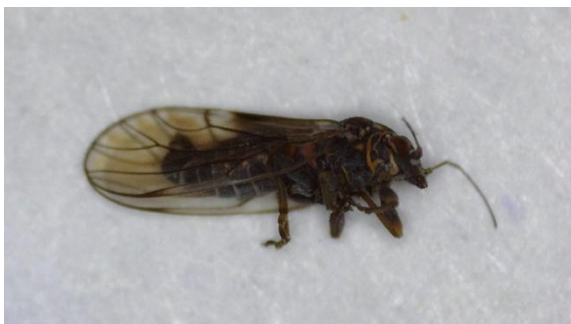
Αρσενικό Cacopsylla pyri