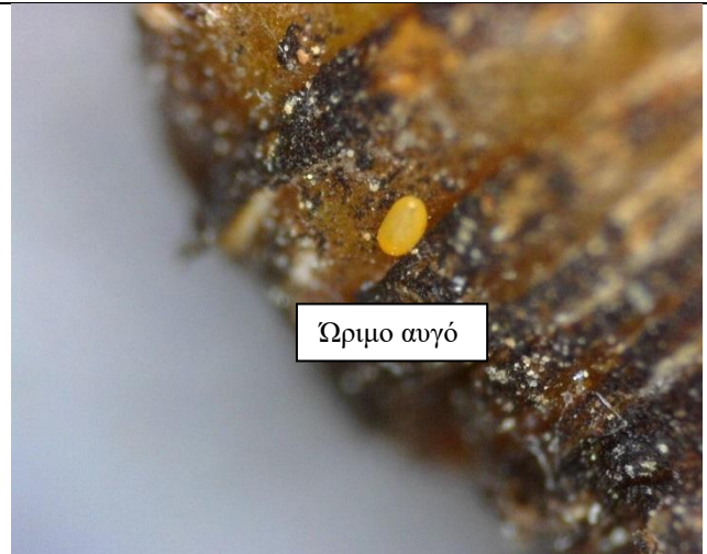
Αυγά Cacopsylla pyri