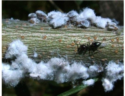
ΒΑΜΒΑΚΑΔΑ ( Euphyllura phillyreae )