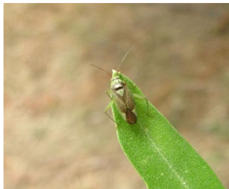
ΚΑΛΟΚΟΡΗ ( Calocoris trivialis )