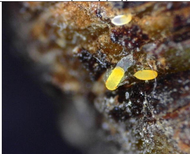
Εκκόλαψη αυγού Cacopsylla pyri