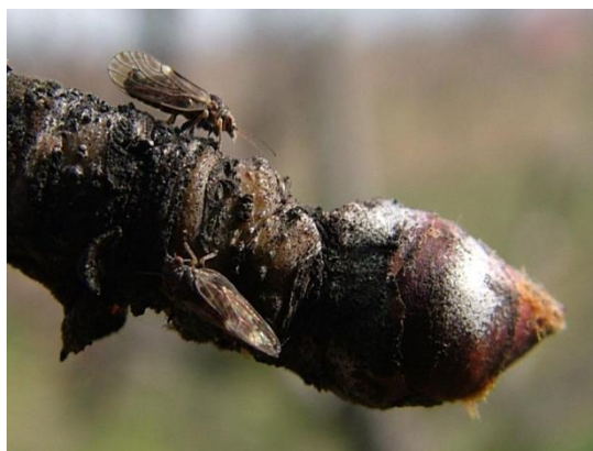
Ακμαία Cacopsylla pyri