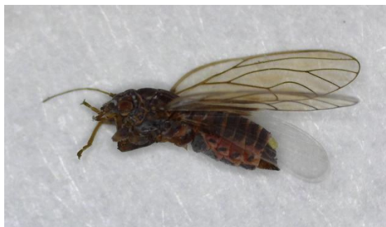
Θηλυκό Cacopsylla pyri