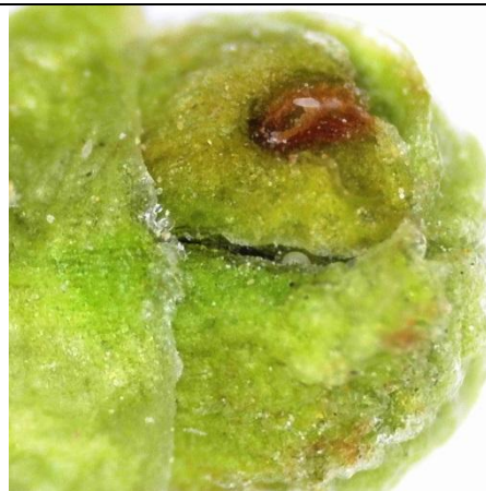
προσβολή και βλάβη από ακάρεα Eriophyidae