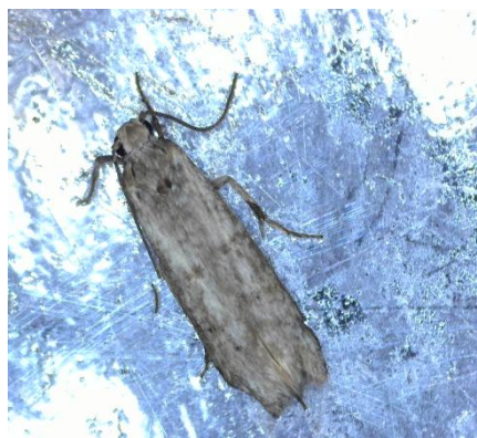
Πυρηνοτρήτης ( Prays oleae )