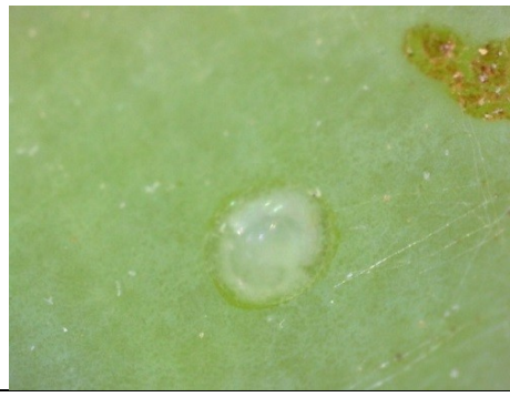
Αυγά και προνυμφική δραστηριότητα Ευδεμίδας