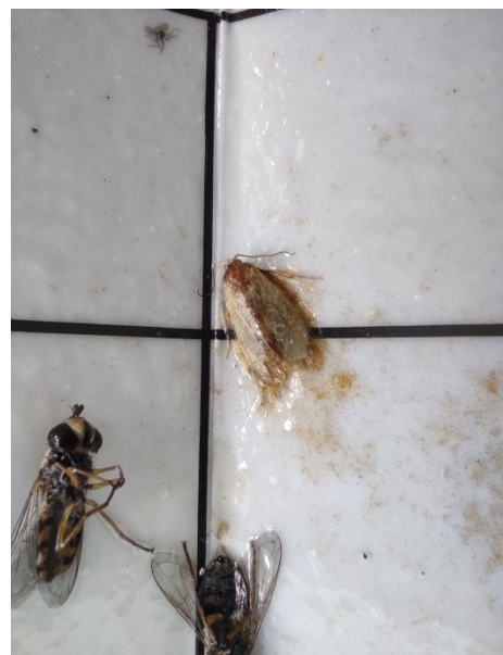
Εικόνα 1. Lobesia botrana