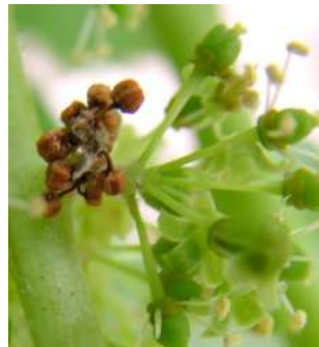
Εικόνα 1. προσβολή ανθοταξίας από προνύμφες 1 ης γενιάς