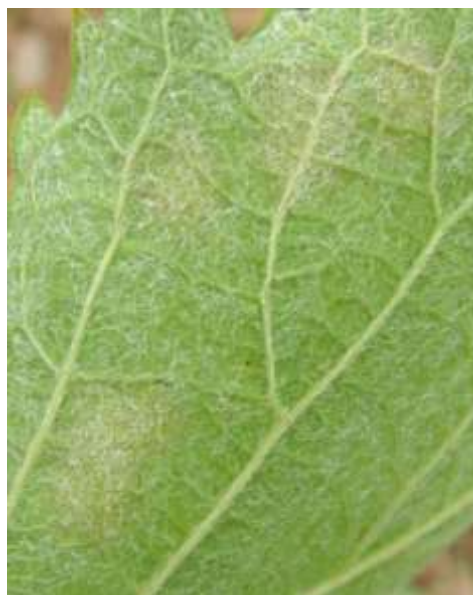
Επάνθιση (καρποφορία του μύκητα) στην κάτω επιφάνεια του φύλλου