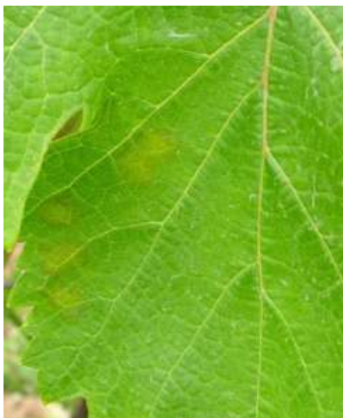
Κηλίδες λαδιού στην πάνω επιφάνεια του φύλλου