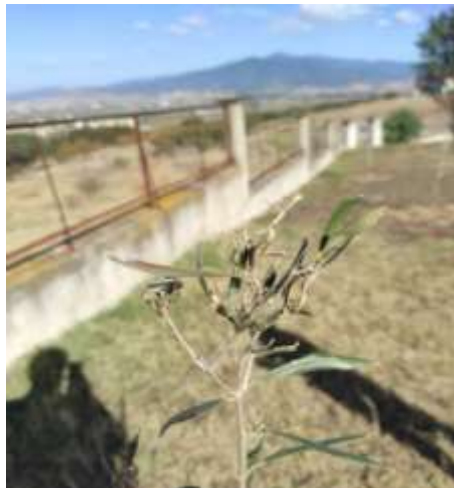
Μαργαρόνια σε νεαρά δενδρύλλια