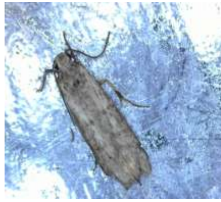
Πυρηνοτρήτης ( Prays oleae )