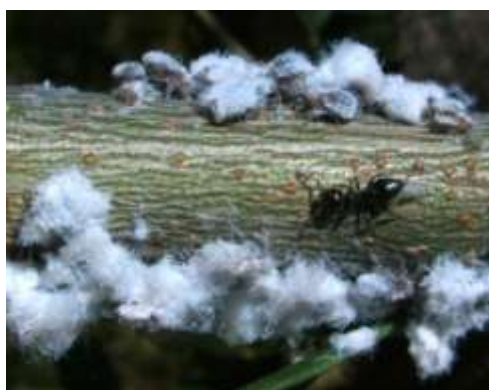
ΒΑΜΒΑΚΑΔΑ ( Euphyllura phillyreae )