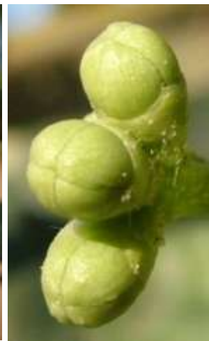
στάδιο Ε Διαφοροποίηση στεφάνης