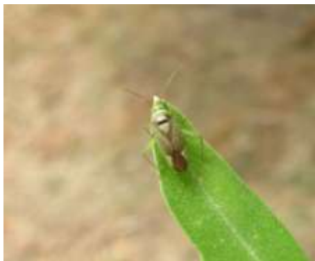
ΚΑΛΟΚΟΡΗ ( Calocoris trivialis )